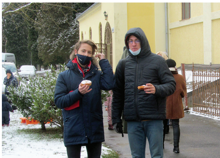
Farsangi szentmise szabadtéren