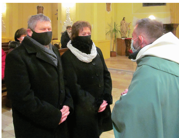
Szentmis hóesésben január 30-án