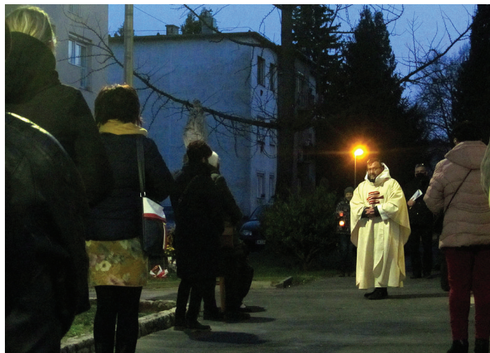
Keresztút és szabadtéri szentmise Szent József ünnepén, március 19-én