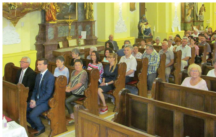
A város miséje