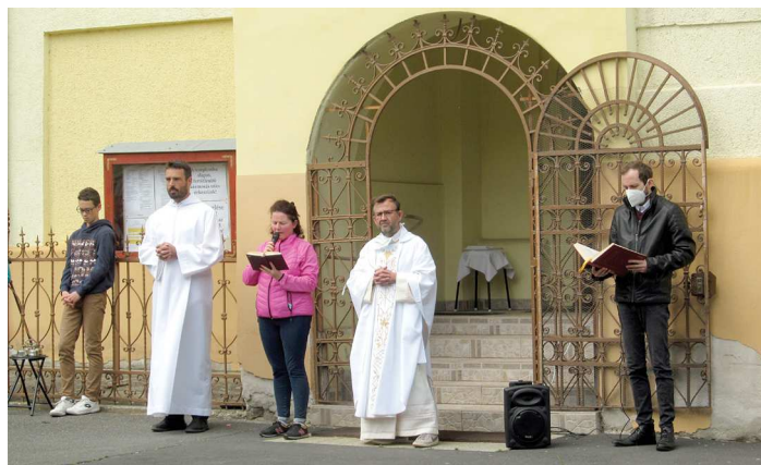
Szabadtéri mise járvány idején