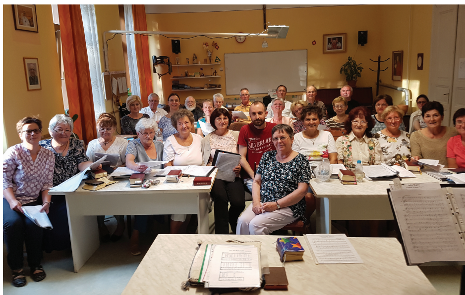
Próbál a Szent József Kórus

Vatikáni Rádió (Rome Reports) Magyar Kurír, Kitekintő, 2014. január