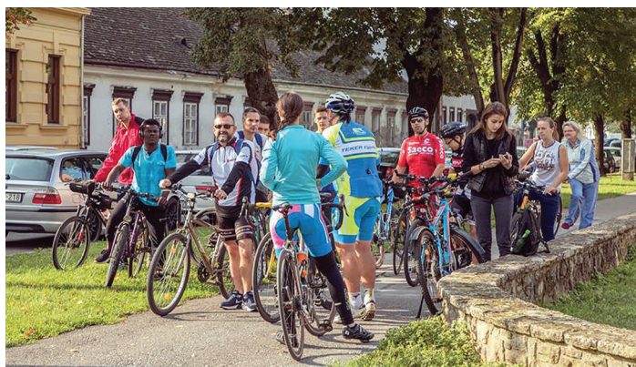
Kerékpáros kirándulás