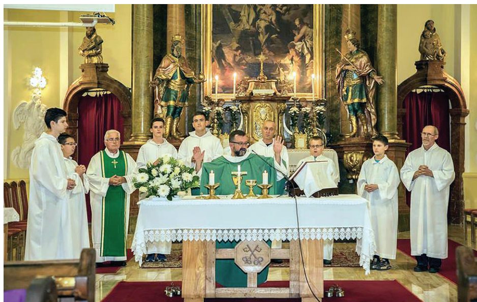
Szentmise Szűz Mária Szent Neve napján