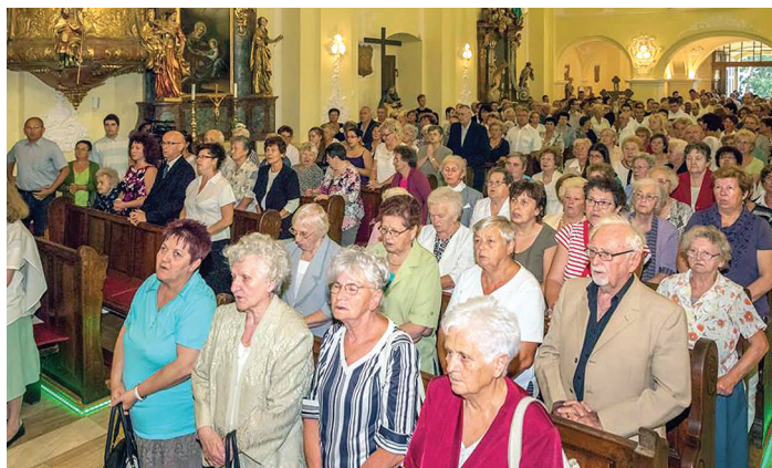
A város miséje 2017. augusztus 20-án