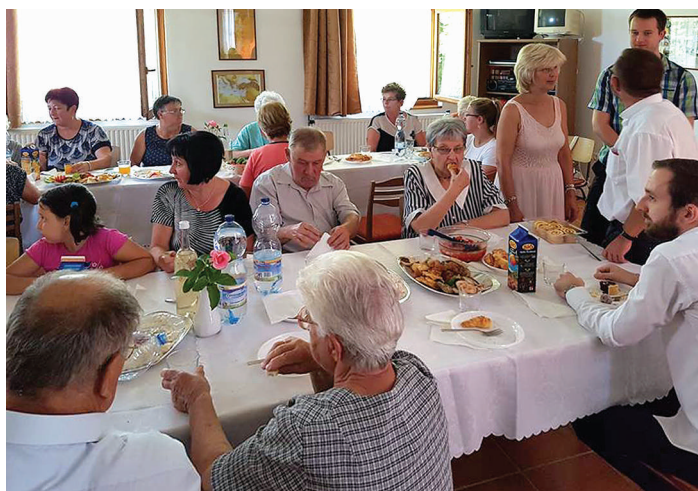
Búcsúi agapé Palinban