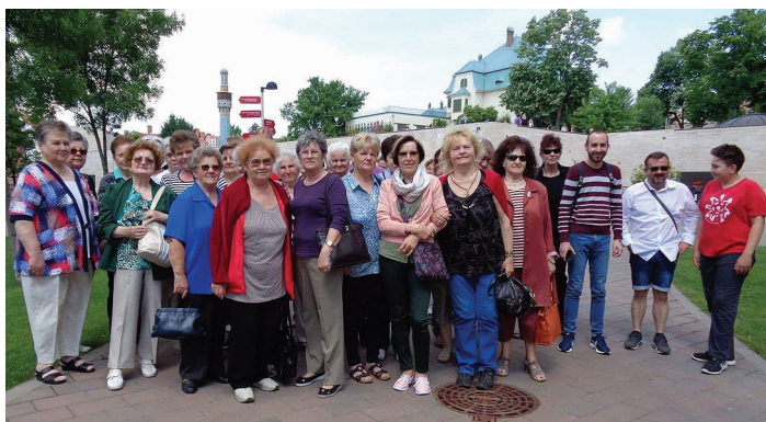
Kirándulás Pécsen — fotó: Bálint Pál