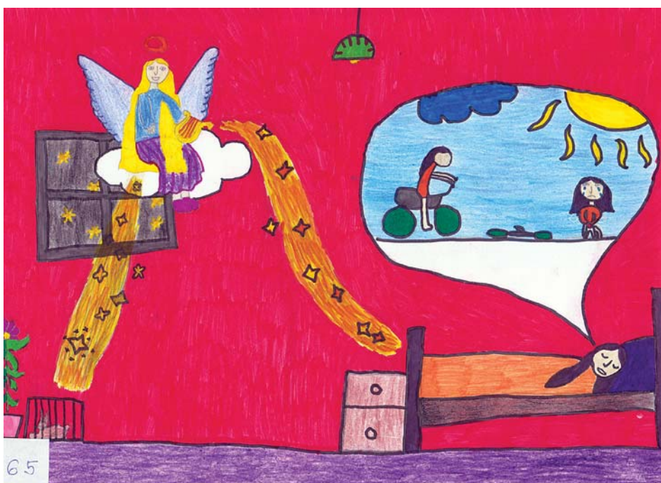
Vuk Sára rajza (Zrínyi—Bolyai Általános Iskola)

Az alábbiakban közöljük a helyezett névsorát, és a rajzokból is bemutunk néhányat, hadd gyönyörködjünk újra ezekben az alkotásokban. Bízunk benne, hogy sokan látták a képeket a templomban, de az is lehetséges, hogy még a karácsonyi időszakban a város