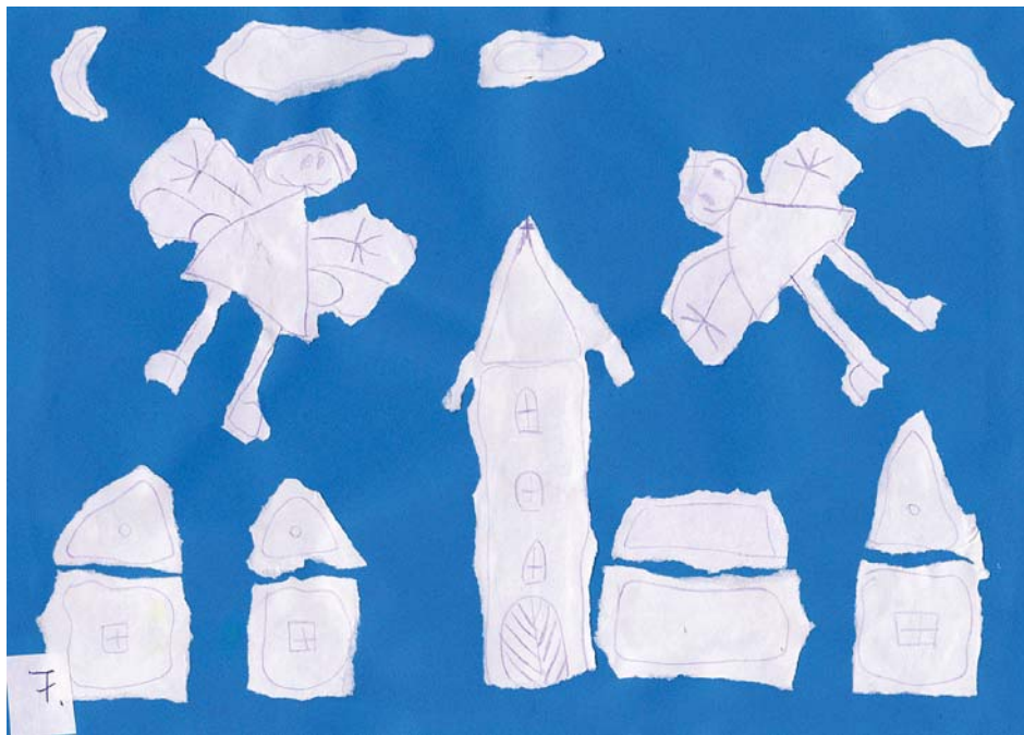
Németh Zsombor rajza (bajcsai óvoda)