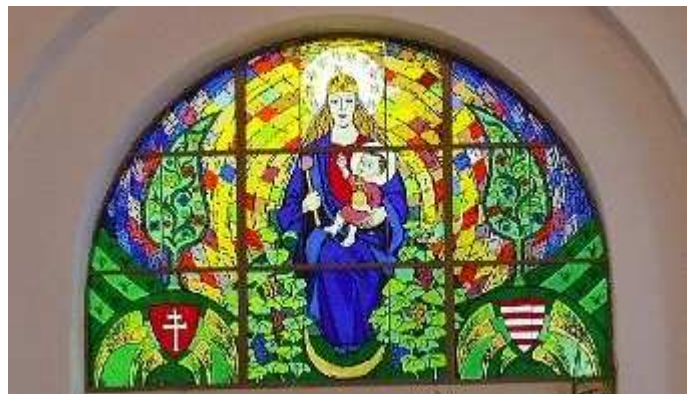
Magyarok Nagyasszonya festett díszüvegablak, Böhönyci, kat. templom

1983 • Corning Museum, New York 1984 • Coleridge Gallery, London • Ernst Múzeum, Budapest 1985 • Art du Verre, Rouen (F) 1988 • Szilikátipari Triennálé, Kecskemét 1989 • XI. Országos Kisplasztikai Biennálé, Pécs 1993 • Stúdió üveg, Szentendre 1995 • Paradoxon - Üveg - Művészet, Iparművészeti Múzeum, Budapest • Üzenet az üvegben, Technika Háza, Kaposvár 1996 • Corpus, Vaszary Képtár, Kaposvár • Vasarely Múzeum, Budapest