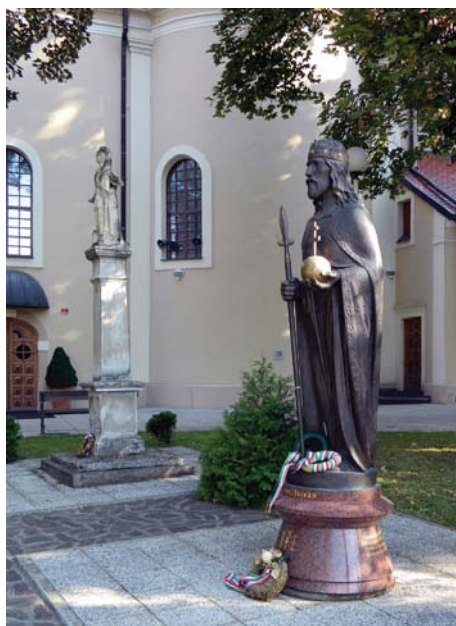
Szent István szobra a templomkertben

Bántornyára vezet utunk ezután, ahol bizonyára az alsólendvai Bánffy-család egy tagja alapította a freskós templomot a tatárjárás utáni években. Itt is dolgozott a híres Árpád-kori festő, Aquila János. A Szent Miklós