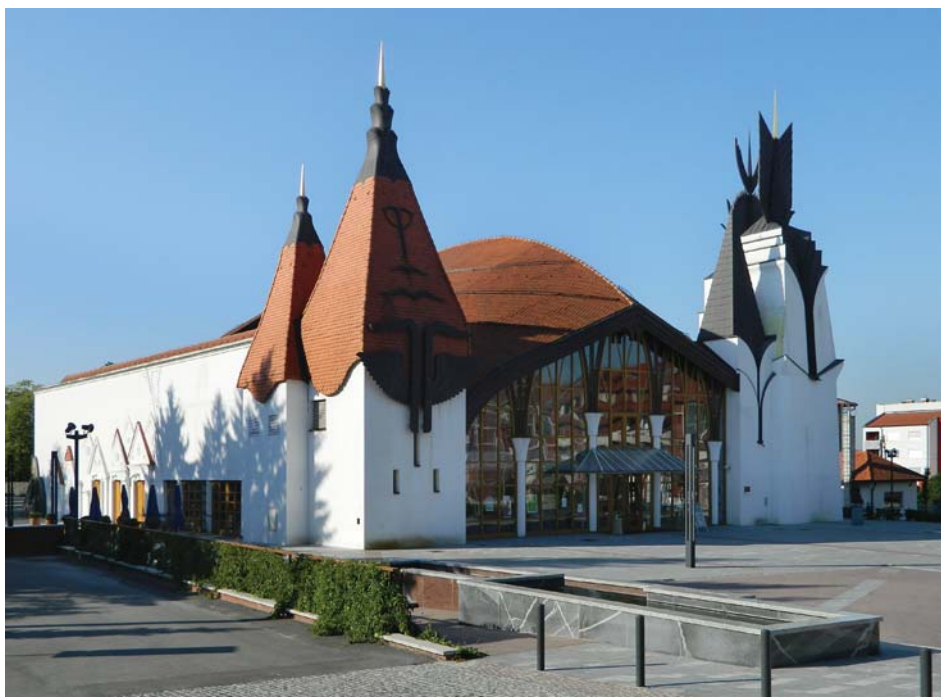
A Makovecz Imre tervezte színház és hangversenyerem

Plébániánk közösségi életének emlékeztető eseményei közé tartoznak a kirándulások. Ezen alkalmakkor elmélyültek az ismeretségek, barátságok szövődtek a hit jegyében. Következésképpen megélnünk az egyházi plébánia közösségi élet, megnőtt az együtt imádkozás és cselekvés igénye.